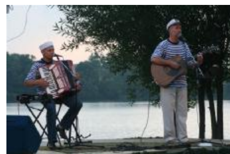
Święto wody i ryby 11 sierpnia 2007r.